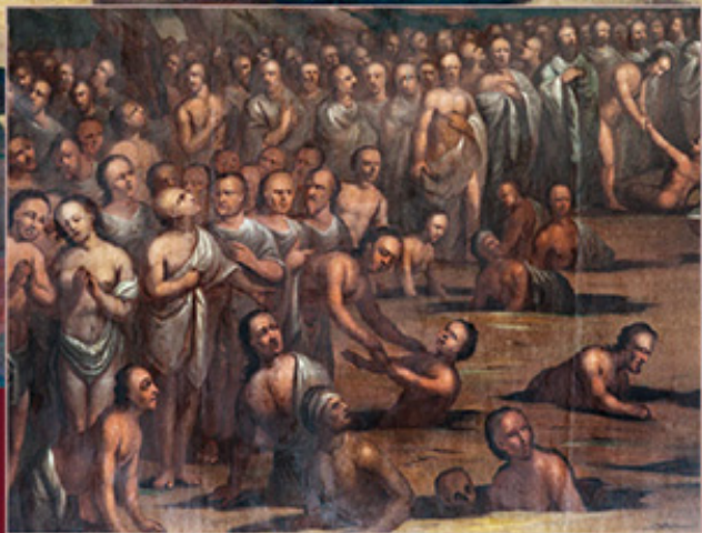
Gemälde des Jüngsten Gerichts von 1735, Ausschnitte