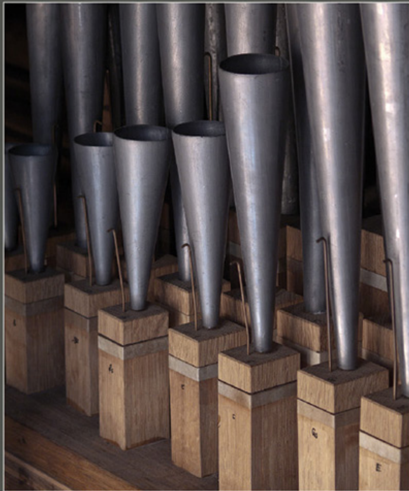
Die gelungene Restaurierung wird sichtbar im organischen Zusammenklang von alten und neuen Materialien.