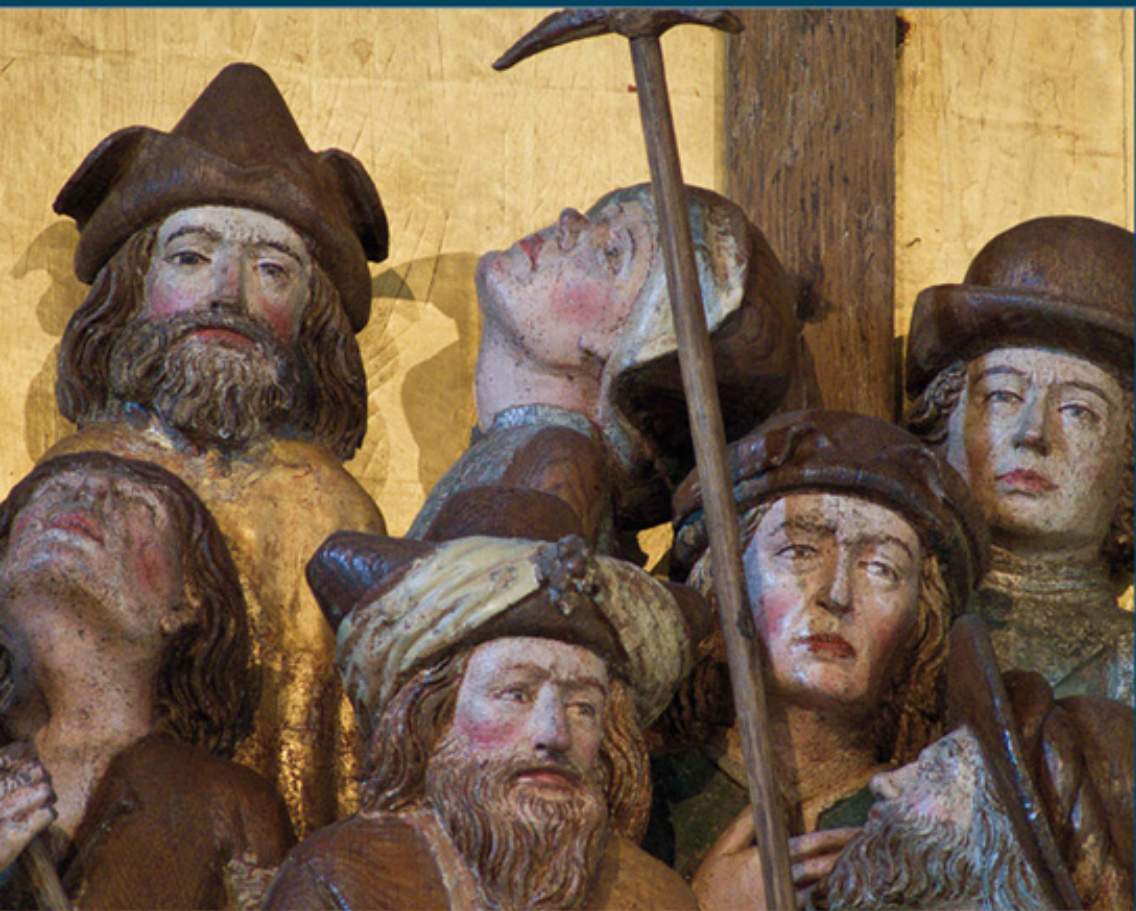
Detail der Kreuzigungsszene