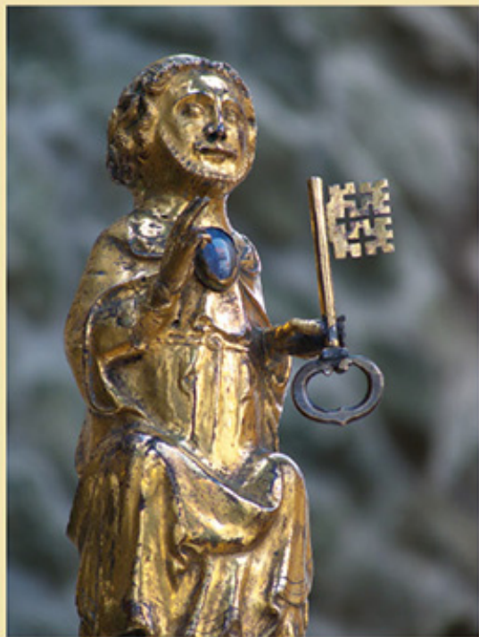
Petrus-Reliquiar, Anfang 14. Jh., aus der Werkstatt des Zigefridus von Soest

[Singet dem Herrn ein neues Lied, denn er tut Wunder. Er schafft Heil mit seiner Rechten und mit seinem heiligen Arm.]