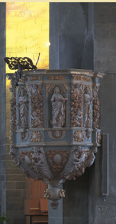
oben: Barock-Kanzel, 1692 – 1693, von Johann Sasse