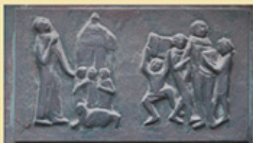
rechts und nächste Seite: Kleppingaltar, Antwerpen 1524, Details